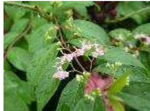
ムラサキシキブの花