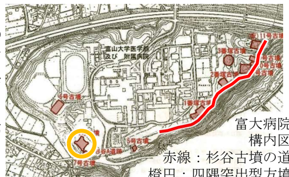
富大病院 構内図 赤線：杉谷古墳の道 橙円：四隅突出型方墳